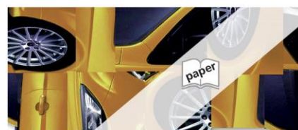
SVBA Tabellen 2024